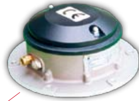
Differential Pressure Switch Druckmelder Contrôleur de pression Segnalatore di pressione