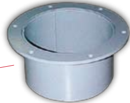
Spigot for Pressure Switch Einschweißstutzen für Druckmelder Raccord pour contrôleur de pression Tronchetto di raccordo per segnalatore di pressione