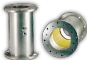
Pinch Valve Quetschventil Vanne à manchon Valvola a manicotto