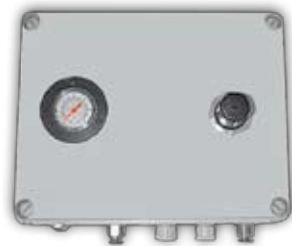
Pinch Valve Control Panel Quetschventil-Druckluftsteuerung Contrôle pneumatique vanne à manchon Comando valvola a manicotto