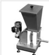
1000 LOSS-IN-WEIGHT FEEDERS DOSIERER MIT DIFFERENZVERWIEGUNG DOSEURS A PERTE DE POIDS DOSATORI A DIFFERENZA PESO