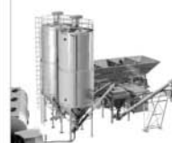
600 SILO SAFETY SYSTEMS SILO-ÜBERFÜLLSICHERUNGEN SYSTEMES DE SECURITE POUR SILOS SISTEMI DI SICUREZZA PER SILO