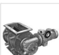
310 BLOW-THROUGH ROTARY VALVES DURCHBLASSCHLEUSEN ECLUSES ROTATIVES A PASSAGE TANGENTIEL ROTOVALVOLE FLUSSO ATTRAVERSATO