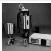
1500 AUTOMATION OF EXTRUSION PROCESSES AUTOMATION VON EXTRUSIONSPROZESSEN CHARGEUR DE PROCÉDES D'EXTRUSION AUTOMAZIONE DI PROCESSI DI ESTRUSIONE