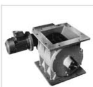
300 ROTARY VALVES ZELLENRADSCHLEUSEN DISTRIBUTEURS ALVEOLAIRES ROTOVALVOLE