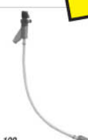
100 FLEXIBLE HELIX CONVEYORS BIEGSAME SCHNECKEN VIS FLEXIBLES TRASPORTATORI FLESSIBILI