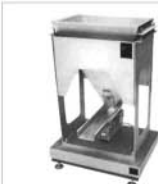
1200 VIBRATING CHANNEL METERING UNIT STUFENLOSE DOSIERANLAGE MIT VIBATIONSRIEHE DOSEUR CONTINU A COLLOIR VIBRANT DOSATORE CONTINUO A CANALA VIBRANTE