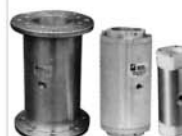
800 PINCH VALVES QUETSCHVENTILE VANNES A MANICHOIN VALVOLE A MANICOTTO