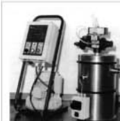
1300 VACUUM LOADER PNEUMATISCHE BELADEINHEIT CHARGEUR PNEUMATIQUE CARICAMENTO PNEUMATICO