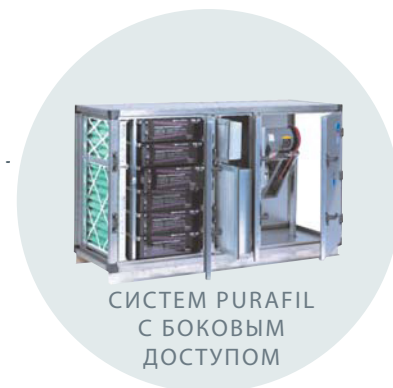
СИСТЕМА PURAFIL С БОКОВЫМ ДОСТУПОМ

PSA Purafil - представляет запатентованную технологию Posi-Track, повышающую эффективность фильтрации за счет надежной и герметичной конструкции, исключающей утечку воздуха.